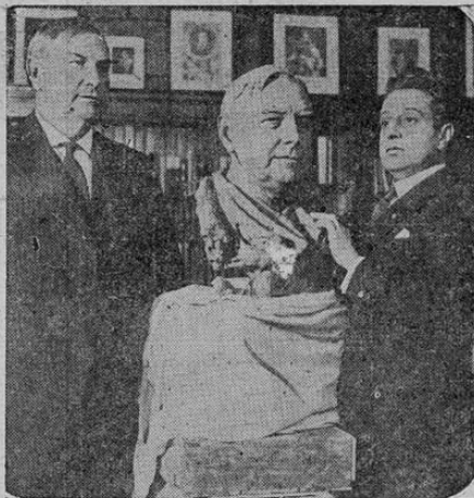
El juez Harlan F. Stone, de la corte suprema de los Estados Unidos, posa para Edgardo Simon, en Washington.