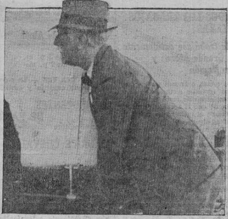
He aquí a Roger W. Babson, estadista americano, fotografiado en San Petersburgo, Florida, en momentos en que se preparaba para hacer un corto vuelo en dirigible.