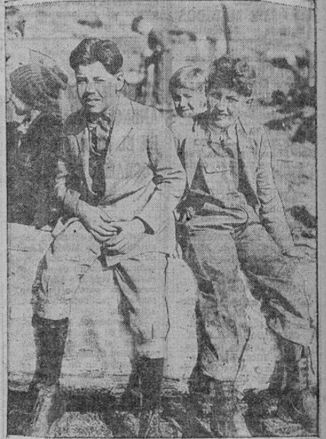
Aquí vemos a algunos de los discípulos de la escuela que el presidente Hoover, ayudado por un grupo de amigos, construyó en Blue Mountain, cerca de Dark Hollow, Virginia, accediendo a la solicitud de varios niños que le visitaron cuando Mr. Hoover pasaba unas vacaciones en ese lugar.