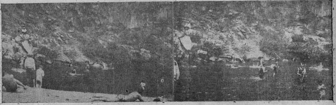
Los domingos tienen su encanto, sabiéndolos buscar, naturalmente. Estos palomos que veis aquí, por ejemplo, empujan bien las mañanitas domingueras trasladándose a la Poza del Tibás, a unos pocos pasos de la capital (en auto), y en sus timpidas aguas se sumergen como en otro Jordán milagroso...